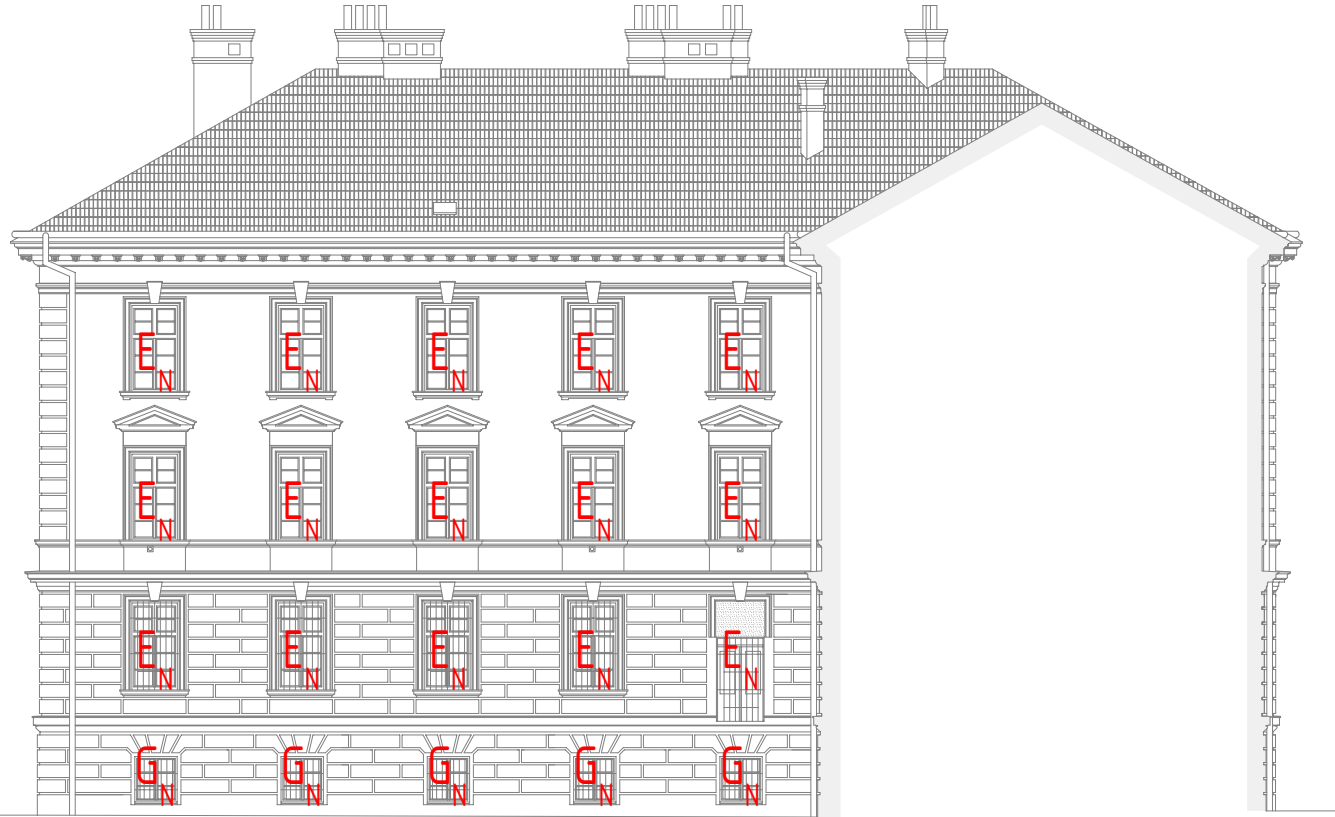
POHLED SEVEROVÝCHODNÍ - DVORNÍ