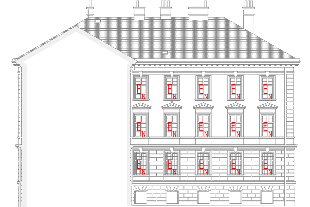
POHLED JIHOZÁPADNÍ - DVORNÍ